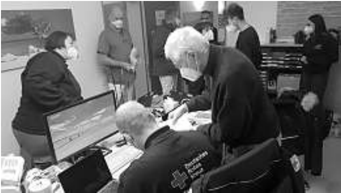
Die DRK-Mitarbeiter der Impfteams richten sich in einem Büro der Sozialgemeinschaft Schiltach/Schenkenzell e.V. ein, für eine zentrale Erfassung der Impffdaten.