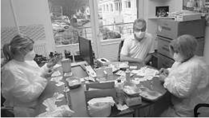
Ein Labor im Verwaltungsbüro: Zentral wurde der gekühlte Impfstoff zeitnah zu den jeweiligen Impfungen in Spritzen aufgezogen und im Haus an die Impffenden verteilt.