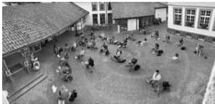
Erste Probe unter Abstands- und Hygieneregeln.

Dann wurden die Auflagen gelockert: seit Anfang Juli treffen sich nach monatelanger Corona-Pause die Musiker des MV Schenkenzell nun endlich wieder zur Probe. Mit Abstand und im Freien.