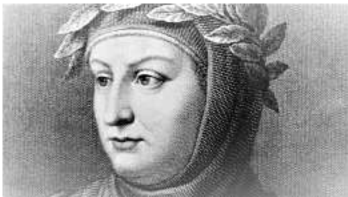
Der Dichter und Schriftsteller Giovanni Boccaccio

Zum historischen Hintergrund weiß man etwa Folgendes: Wie das Corona-Virus hat auch die Pest ihren Ursprung vermutlich in China. Dort war die hoch ansteckende Krankheit 1332 ausgebrochen und wurde über Kaufleute zunächst in europäische Hafenstädte eingeschleppt. 1348 erreichte sie Florenz. Giovanni Boccaccio war ein berühmter Sohn der Stadt. Neben Petrarca und Dante zählt er zu den berühmtesten Dichtern Italiens.