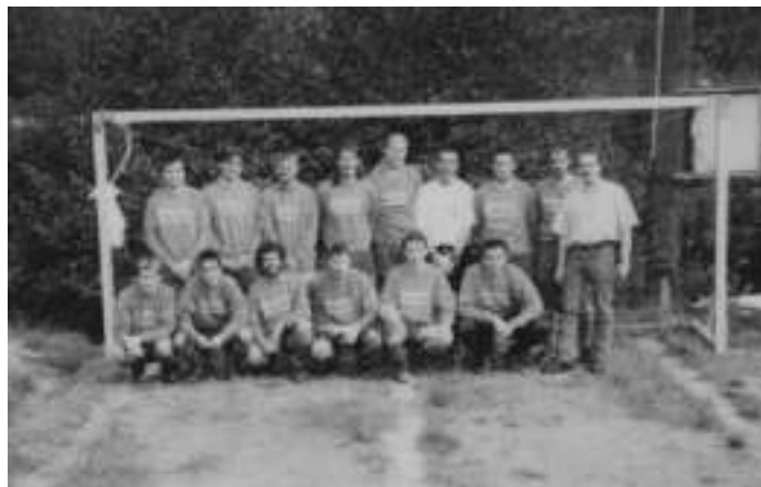
Die erste Mannschaft nach der Wiederaufnahme des Spielbetriebs