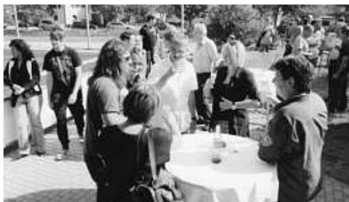
Zahlreiche Gäste erschienen 2010 zum ersten offiziellen Sponsorentag des KSC