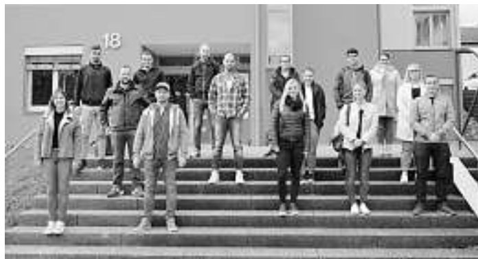
15 Teilnehmerinnen und Teilnehmer starteten in der Bildungsakademie Rottweil ihre Vollzeit-Weiterbildung zum geprüften Betriebswirt.