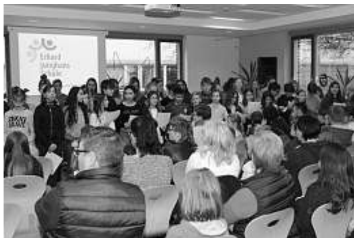
musikalische Begrüßung in der Mensa